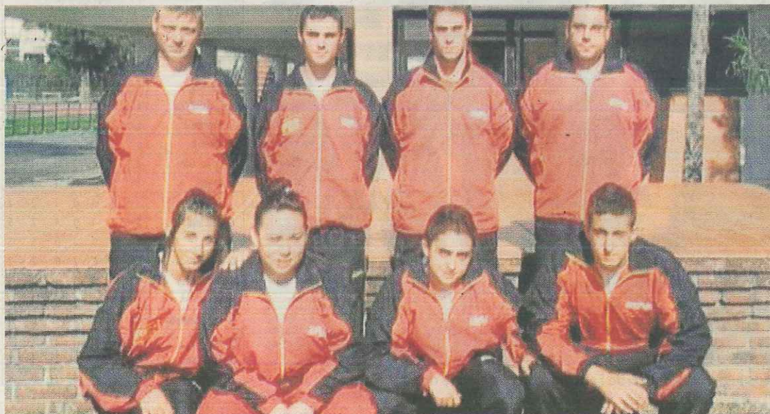
Los integrantes de la selección española en Buenos Aires.

La palista del Cártama conquista en dobles dos medallas de oro y una de plata en los Iberoamericanos • También peleará por vencer en la categoría sub 18